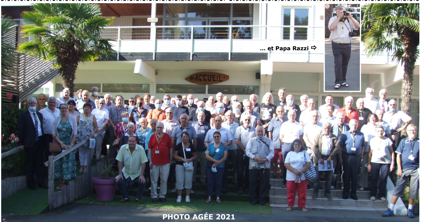
PHOTO AGÉE 2021

NDLR : Là, le rédacteur s'est sur-PASS-é