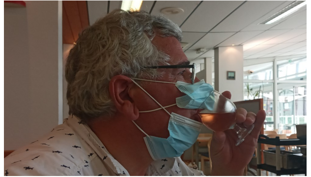
Qui a dit que le port du masque empêche