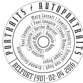
Visuels disponibles sur demande