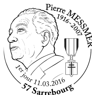
Maquette non contractuelle Visuel d' disponible sur demande