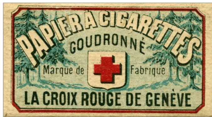
9 Marque de papier à cigarette au nom de la Croix-Rouge de Genève.

conception donnaient des noms à ces marques qu'ils créaient et même pour les papiers à cigarettes (9) et les paquets de tabac, qui seront façonnés dans des papiers richement colorés et décorés avec recherche, c'est la signature du fabricant. Ils iront jusqu'à choisir des noms de personnes ou de faits notables qui pouvaient flatter les fumeurs des pays où étaient exportés ces produits. Les couleurs prédominantes sont le rouge et l'or, même si aujourd'hui cette mode change un peu.