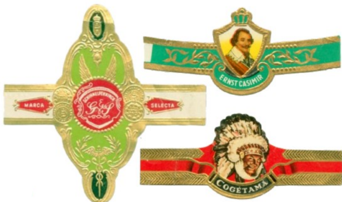
8 Modèles de bagues de cigares.

Jusqu'en 1940, de magnifiques étiquettes et bagues de cigares sont confectionnées en lithographie et même souvent dorées à l'or fin et gaufrées (8). Leurs créateurs, lors de leur