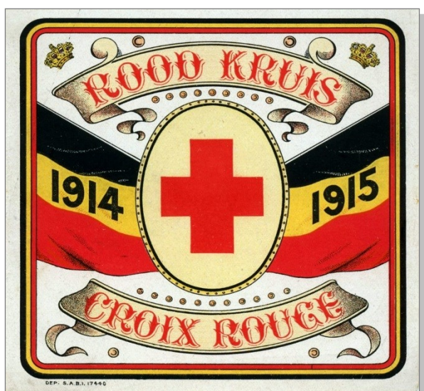
7 Etiquette de boîte à cigares de la Croix-Rouge des Pays-Bas de 1914 - 1915 (Réf : DEP. S.A.B.I. 1744D).

ensemble d'étiquettes pour coffrets ou boîtes à cigares (7), qui allaient habiller les différentes faces extérieures de ces boîtes ou coffrets, chacune ayant un nom particulier selon son emplacement.