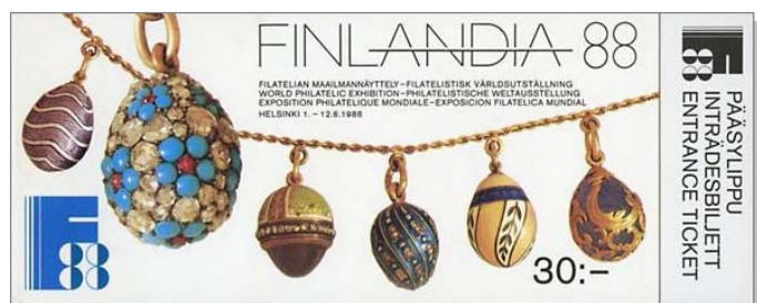
3 Carnet de timbres sur les bijoux de Fabergé, Exposition Finlandia 1988.