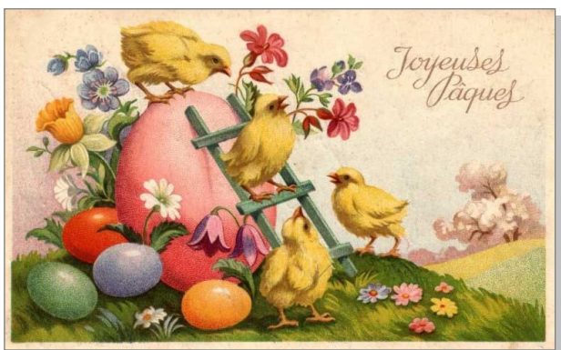
1 Carte postale célébrant Pâques et le printemps.

La fête juive et la fête chrétienne portent le même nom, mais notons que Pâque, sans « s », au féminin désigne d'après le Petit Robert « la fête juive annuelle qui commémore l'exode d'Egypte ». Pâques, au pluriel, représente « la fête chrétienne célébrée le premier dimanche suivant la pleine lune de l'équinoxe de printemps, pour commémorer la résurrection du Christ ».