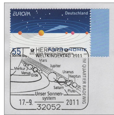
5 Le système solaire. Oblitération du 17 septembre de Herford (Allemagne) - Journée mondiale de l'enfance 2011.

4 planètes géantes externes (Jupiter, Saturne, Uranus et Neptune) et d'une ceinture d'astéroïdes. Mais au Moyen-Âge, les astrologues basent leurs prédictions sur les 7 planètes majeures auxquelles les alchimistes de l'époque font correspondre les 7 principaux métaux : le plomb, l'étain, le fer, l'or, le cuivre, le mercure, l'argent. L'observation du ciel conduit à la découverte de la Grande Ourse formée de 7 étoiles.