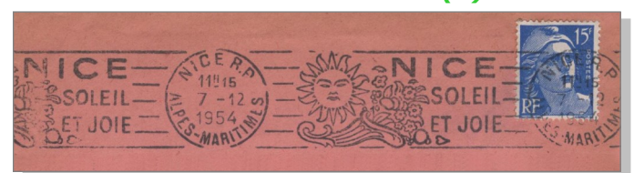
6 Nice Soleil et joie. Oblitération Krag 1 ère génération de Nice RP du 7 décembre 1954. Affranchissement avec un 15F Marianne de Gandon outremer.

4 planètes géantes externes (Jupiter, Saturne, Uranus et Neptune) et d'une ceinture d'astéroïdes. Mais au Moyen-Âge, les astrologues basent leurs prédictions sur les 7 planètes majeures auxquelles les alchimistes de l'époque font correspondre les 7 principaux métaux : le plomb, l'étain, le fer, l'or, le cuivre, le mercure, l'argent. L'observation du ciel conduit à la découverte de la Grande Ourse formée de 7 étoiles.