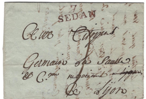
4 Ajout d'une virgule à la barre horizontale sur le 7 d'origine sans barre. Lettre de 1801 de Sedan pour Lyon. Marque linéaire 7 SEDAN et taxe de 7 décimes.

(5) Le système solaire est constitué d'une étoile, le Soleil, de 4 planètes telluriques (Mercure, Vénus, la Terre et Mars), de