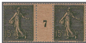
2 Paire de Semeuse lignée 15 c vert-gris avec inter panneau portant le chiffre 7.

Perfectionnant le système de numération hindou, les Arabes ont créé les chiffres arabes qui se répandirent dans l'Europe médiévale. À son origine, le chiffre sept était un J inversé. Il n'y avait pas de barre transversale.