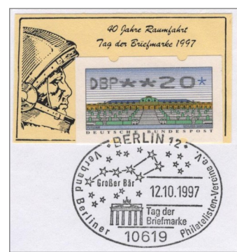
7 La Grande Ourse. Oblitération commémorative du 12 octobre 1997 Berlin-Journée du Timbre.