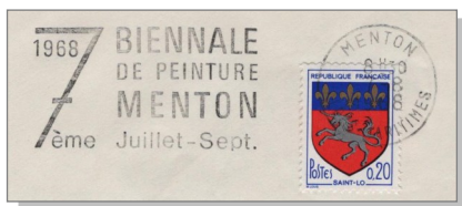
3 7 e biennale de peinture de Menton. Oblitération d'août 1968 avec flamme commémorative.

Les Franco-phones ont ajouté une barre au chiffre 7 pour le distinguer du 1 écrit avec une « accroche » oblique en haut à gauche.