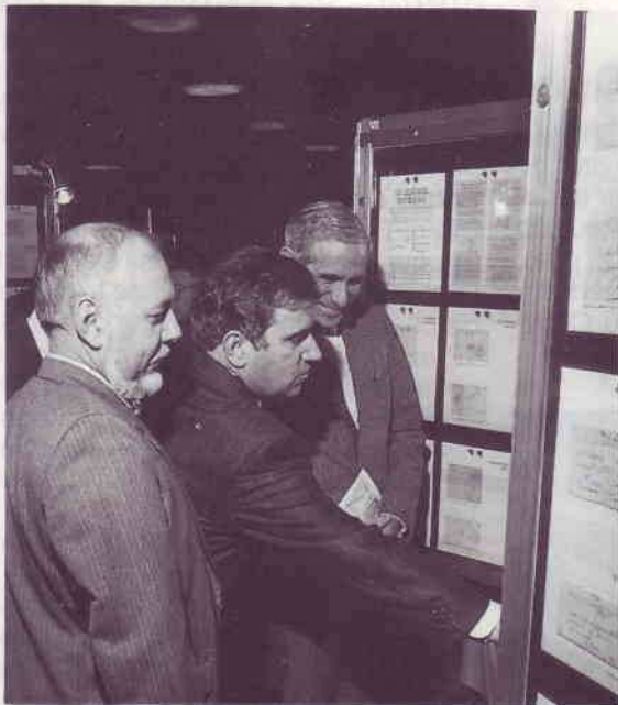
En haut : Vue de la salle d'exposition.