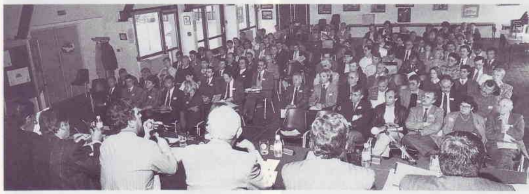
Des délégués attentifs aux propos de l'orateur.

Progression des effectifs, excellente santé financière, création de deux sections (télécarte et marcophilie « ancienne ») : ce sont quelques uns des points forts de la 37ème assemblée générale de l'Union des philatélistes des PTT, qui s'est tenue à Kerjouanno en avril dernier. Avec une ombre au tableau : la position de l'UPPTT au sein de la Fédération des sociétés philatéliques françaises.