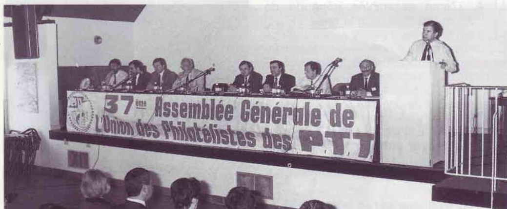
La tribune à l'ouverture des travaux.