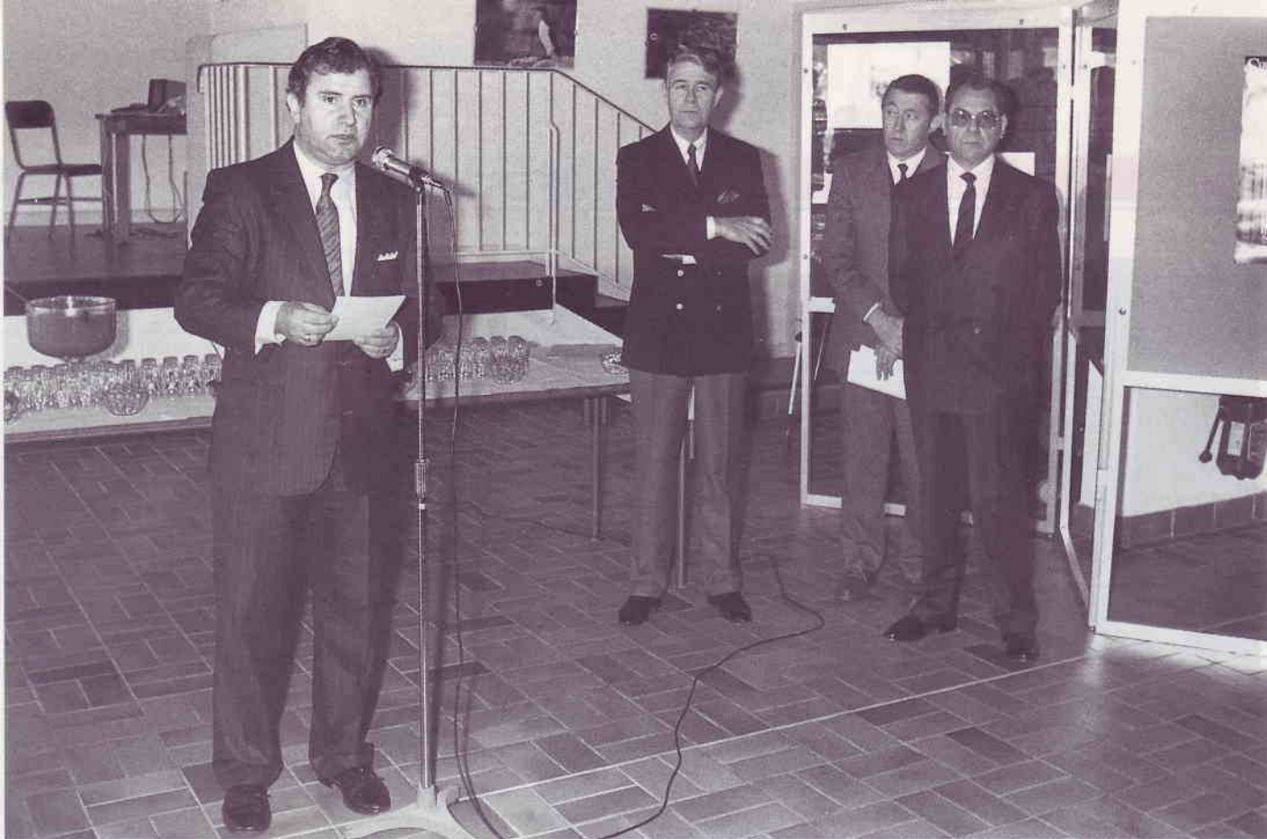
Le Président général clôturant l'assemblée.