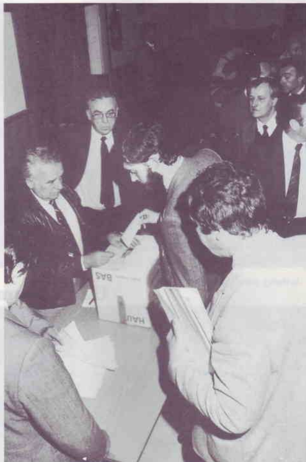
Une affaire sérieuse : les élections.