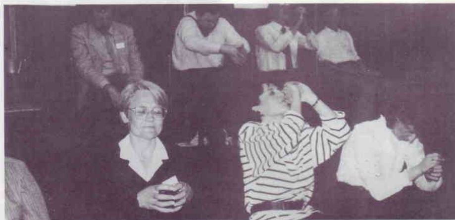
Tout le monde dort ou rêve sous l'effet de l'hypnose

Au programme de ces deux journées figuraient également des spectacles plus classiques. Comme le groupe folklorique de Lorgues qui a interprété des danses provençales. Enfin, le dernier soir, l'orchestre Morrys André a animé à grand renfort de décibels le bal de clôture.