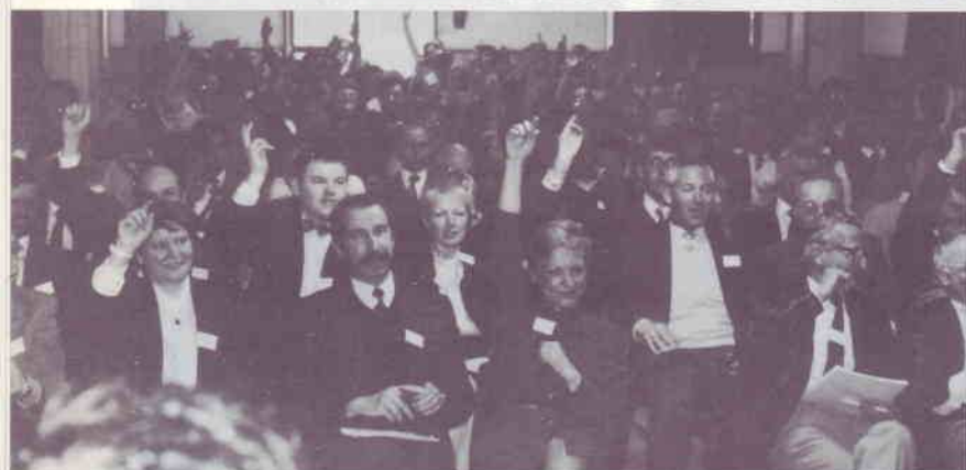
Une assemblée qui vote les rapports.