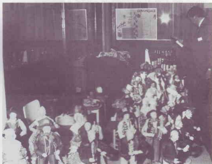
Le stand des santons.