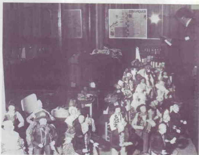
Le stand des santons.