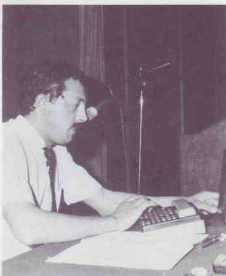
Résultat des élections sur minitel par Jean-François Thivet.