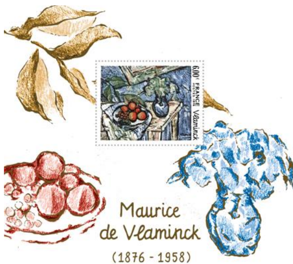
Maurice de Vlaminck (1876 - 1958)