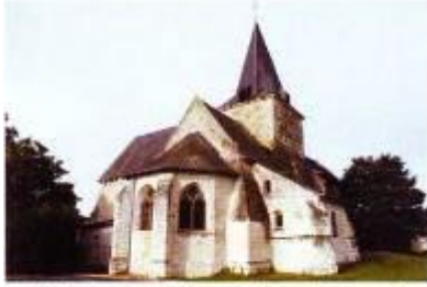
Eglise Saint-Hilaire XII e - XV e Siecle