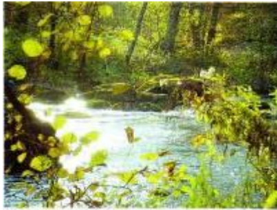
Site du Val d'Orne