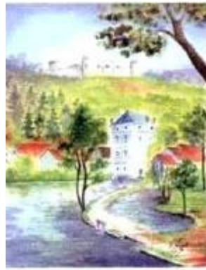
Trouves les belles fontaines Yonne