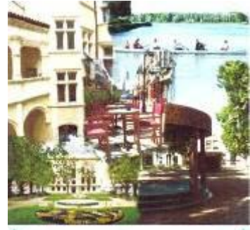
VILLEFRANCHE, LE BEAUJOLAIS EN CAPITALE !