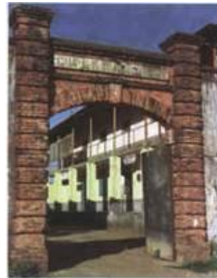
Patrimoine guyanais CAMP de la TRANSPORTATION Saint Laurent du Maroni

Exposition aux Archives Départementales du 7 septembre au 30 novembre 2007