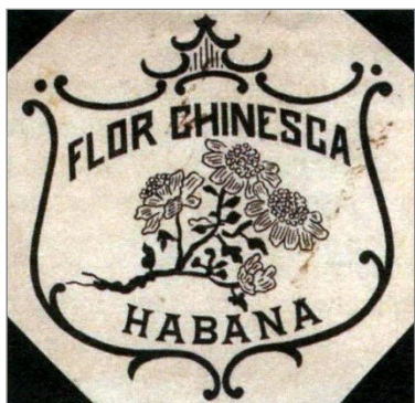
① Une des marques dites "Hierro".