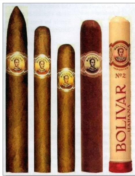
③ Vitola ou anneau pour cigare est placée à environ 2 cm de la tête du cigare.

(3), à l'origine de ce type de collection qui a pour nom « La Vitolphilie », tiré du mot espagnol qui précède et du grec « Philos » celui qui aime. Il faut savoir que les principaux pays producteurs sont hispanophones.