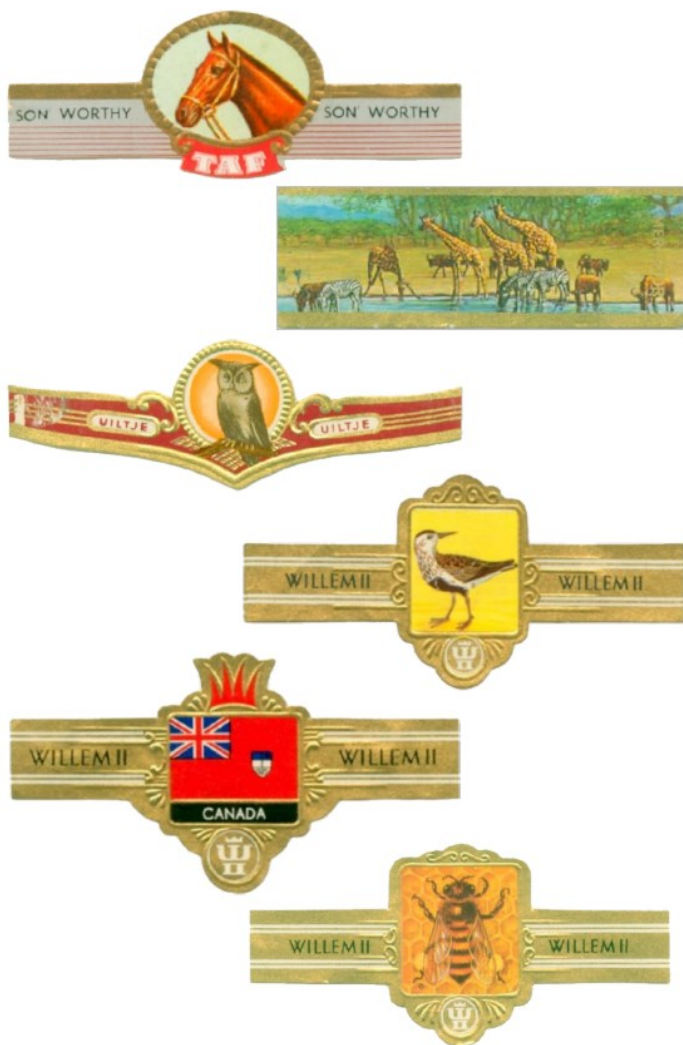
11 Bagues de cigares thématiques.

pour coffrets réveillèrent rapidement l'intérêt des collectionneurs, fumeurs ou non, qui commencèrent à garder et classer ces belles pièces. On peut ainsi admirer un nombre incalculable de personnalités, artistiques, littéraires, politiques et militaires, des lieux et paysages de divers pays, des animaux ainsi que des scènes de la vie sociale et culturelle de nombreuses nations, particulièrement celle de Cuba et d'autres. Quant à la marque imprimée, elle constitue sans aucun doute une sorte d'acte notarié qui justifie que telle pièce enlaçait le corps d'un cigare ou embellissait le couvercle et l'intérieur d'une boîte à cigares.