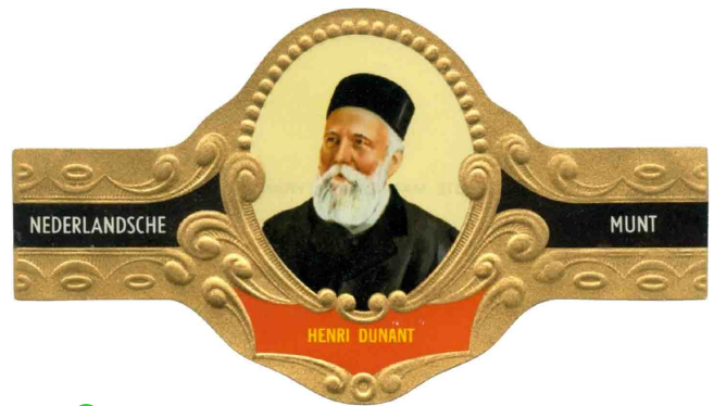
12 Bague de cigare des Pays-Bas de la série 79 « Grote Mannen en Tyrannen », série Hommes célèbres et Tyrans de 1965, Portrait d'Henri Dunant, en petite et grande dimension Ø 1,5 et 4 cm. Série de 100 bagues en 5 groupes de 20, sortie entre 1965 et 1967. Fabricant : Nederlandsche Munt.