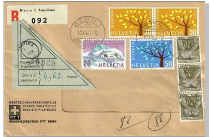
1 1962 - Étiquette triangulaire verte et taxe de dédouanement, tarif du 6 janvier 1959 au 12 janvier 1969 : 60 c.

Les objets taxés par la douane à l'importation étaient identifiables visuellement au chantier paquets ou au tri par la présence sur leur emballage d'une étiquette triangulaire de couleur verte (1). Elle portait le montant des droits à