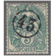
10 Griffes du bureau de Poste 43.