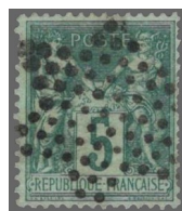
7 Étoile pleine.

Les griffes les plus couramment utilisées et relativement faciles à trouver sont celles effectuées avec le timbre indicatif des bureaux de quartier se caractérisant par un cercle avec au