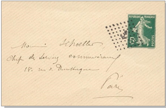
4 Oblitération ancre de marine.

Ces marques sur timbres détachés sont relativement rares et peuvent atteindre une belle petite somme lorsqu'on les trouve sur lettres. Plus courant le timbre à date oblitérant également « à numéro d'ordre » de la 2 e génération (gros chiffre) (5 & 6) mis en service