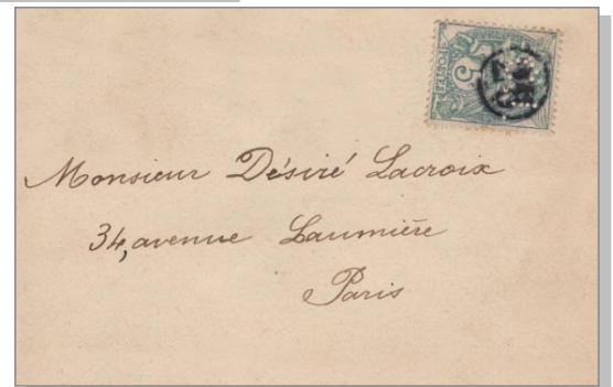
10 Chiffre 28 sur timbre perforé CL (Crédit Lyonnais).