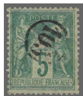
8 Oblitération N° 103 écriture arabe.

centre le numéro du bureau (8, 9, 10, 11 & 12).