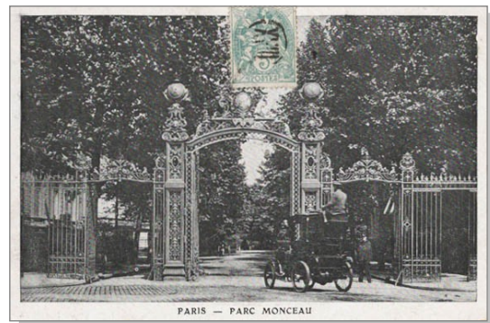
12 Bureau XVIII en chiffre romain.

La couleur de toutes ces oblitérations est souvent noire mais on peut en trouver en rouge ou en bleu.