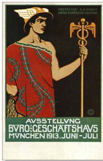
④ Entier bavarois timbré sur commande avec timbre à l'effigie Léopold 5 Pf. Face image : publicité pour une exposition consacrée aux locaux d'entreprise - Munich 1913. Mercure tenant le caducée.

Mais pour ce dictionnaire, c'est aussi la verge entrelacée de deux serpents, qui est l'attribut de Mercure (4).