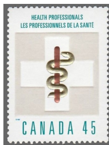
③ Canada – émission de 1998 en l'honneur des professionnels de la santé. Caducée réduit au bâton et au serpent.

et entourée de deux serpents entrelacés. Pour le Littré , le caducée est l'emblème des médecins, des professionnels de la santé et des juristes. Étymologiquement, le mot caducée vient du latin caduceum et par altération, du grec kêrukeion , de kêrux , héraut.