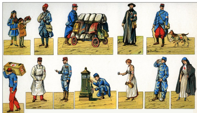
2 Éditions H. Bouquet à Paris. Série « Pro Patria » planche n°13.