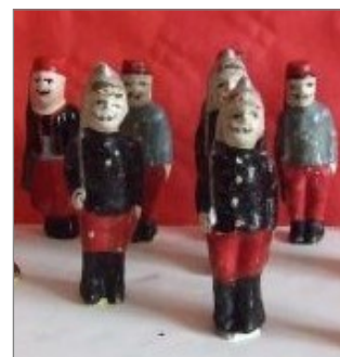
3 Figurines en papier-mâché.

Dès 1870, la maison Duménil a fabriqué des figurines en terre cuite, plâtre et farine (4). En Allemagne à cette époque on fabriquait des figurines en tôle, plates et en fer blanc.