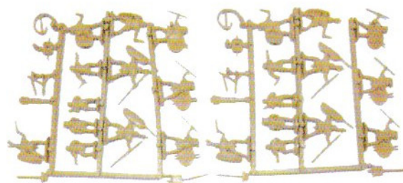
Figurines en matières plastiques teintées dans la masse et injectées sous pression.