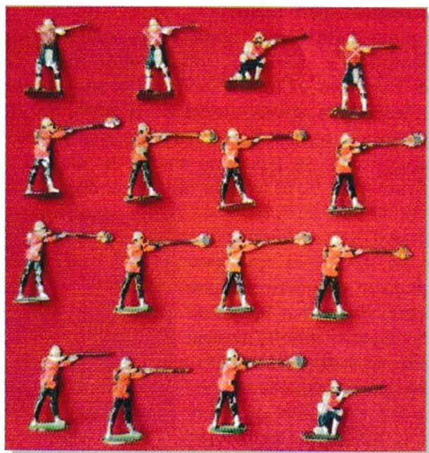
Planche de plats d'étain mise en couleurs.