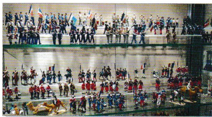
Vitrine pour collection de figurines.

C'est primordial de les ranger si vous ne voulez pas être envahi par votre collection. Vous devez donc choisir votre mode de classement. Pour débiter, le plus facile c'est la boîte à chaussures, mais lorsque la collection devient trop volumineuse, vous pouvez les mettre dans des vitrines ou même les présenter sous forme de maquettes ou de scénettes.