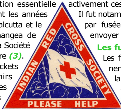
3 Sigle de la société de Croix-Rouge Indienne.