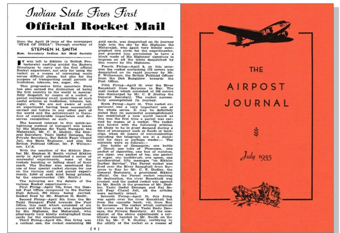
3 et 4 The Airpost Journal.

1927, Stephen Smith fut l'auteur d'un petit livre « Les incidents internationaux de la zone de danger » couvrant les incidents des vols aériens du sud de Calcutta traversant la Baie du Bengale jusqu'à la Birmanie et la Thaïlande. En plus des bulletins régulièrement écrits pour The Airpost Journal (4),