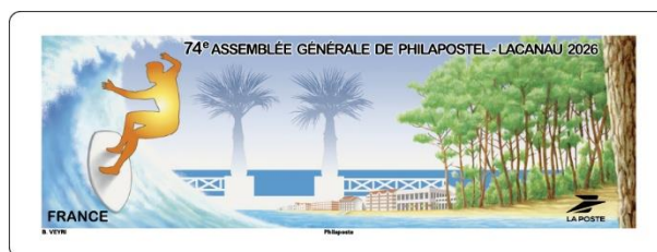
Dessin de l'illustrateur Bernard VEYRI.

PHILAPOSTEL vous propose de souscrire à ces produits, spécialement créés pour cet évènement par des artistes d'exception, selon les modalités figurant dans le bon de commande ci-après et dans la limite des stocks disponibles.