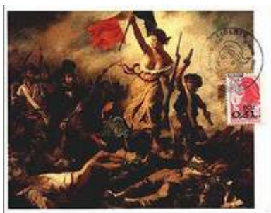
Carte maximum sur la Liberté guidant le peuple